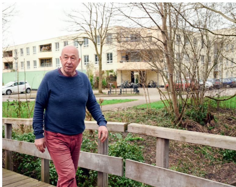
Boven: "Mijn woning staat in de leukste buurt van Utrecht."