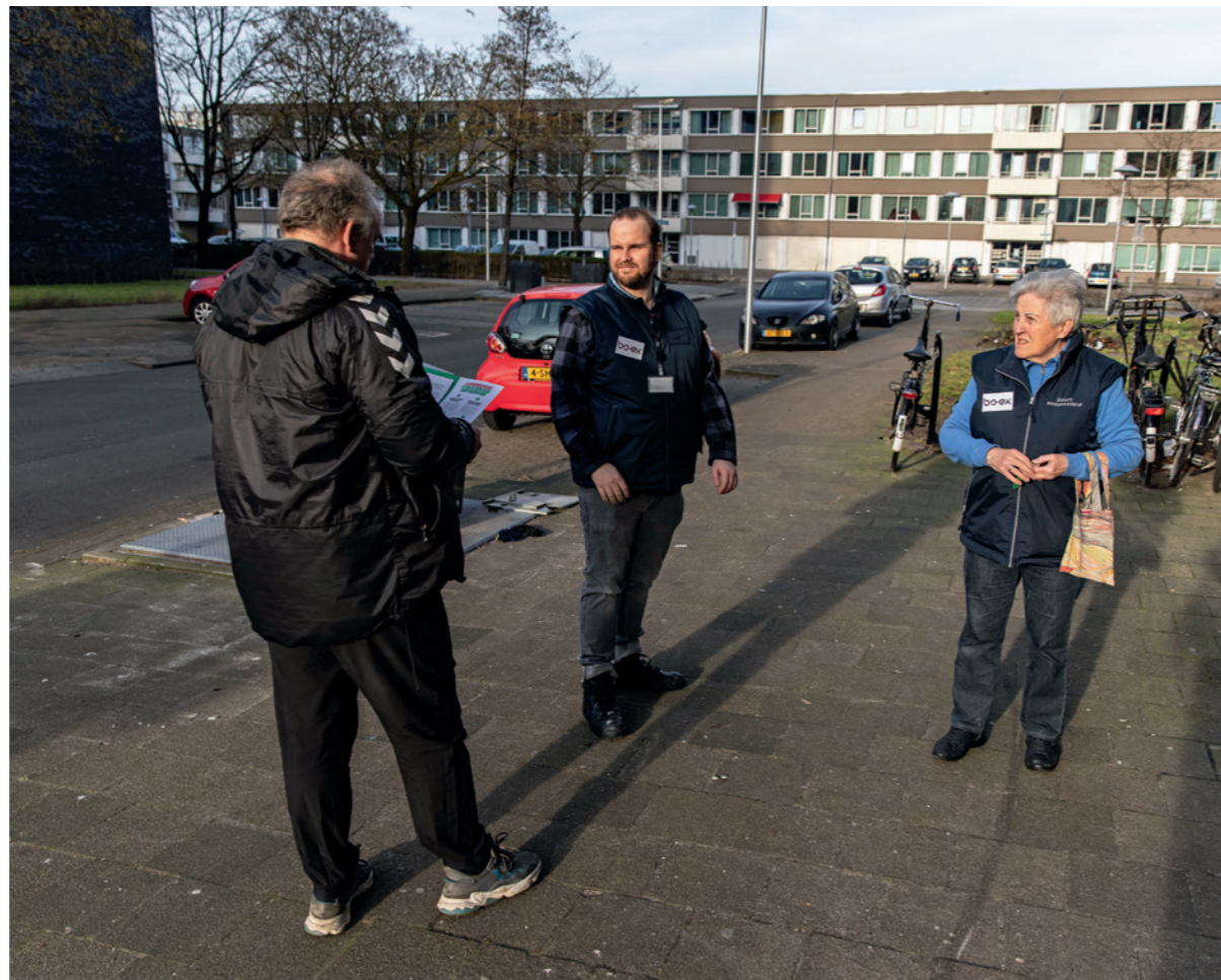
Onder: de buurtambassadeurs op hun rondje door de wijk.